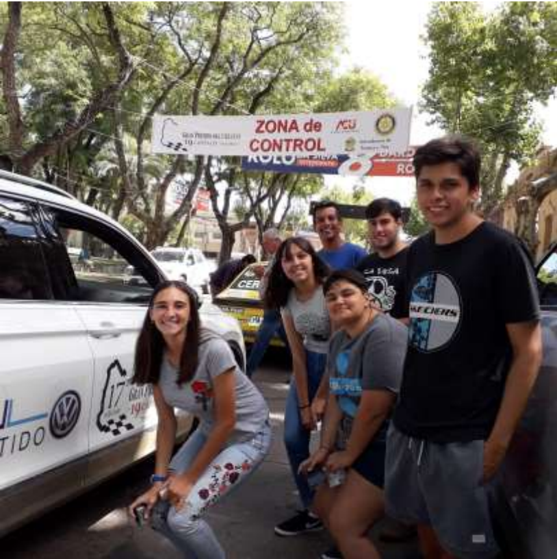
Recibiendo el Rally 19 Capitales.