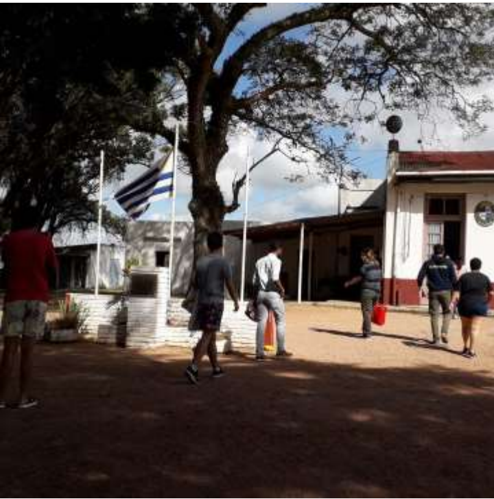
Donación de útiles escolares en Escuela No 4 Dionisio Díaz de Pueblo El Oro.