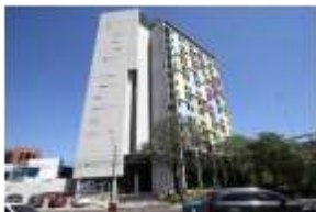
Aloft Asunción Avenida Aviadores del Chaco, Asunción. A 400 metros del Hotel Sede USD 91 - GS 583.000