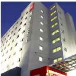
Ibis Asunción Avenida Aviadores del Chaco, Asunción. A 120 metros del Hotel Sede USD 102 - GS 652.800