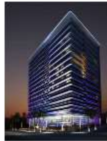
Dazzler by Wyndham Avenida Aviadores del Chaco, Asunción. A 120 metros del Hotel Sede USD 117 - GS 748.800