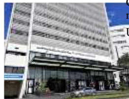
Esplendor by Wyndham Avenida Aviadores del Chaco, Asunción. A 650 metros del Hotel Sede USD 106 - GS 678.400