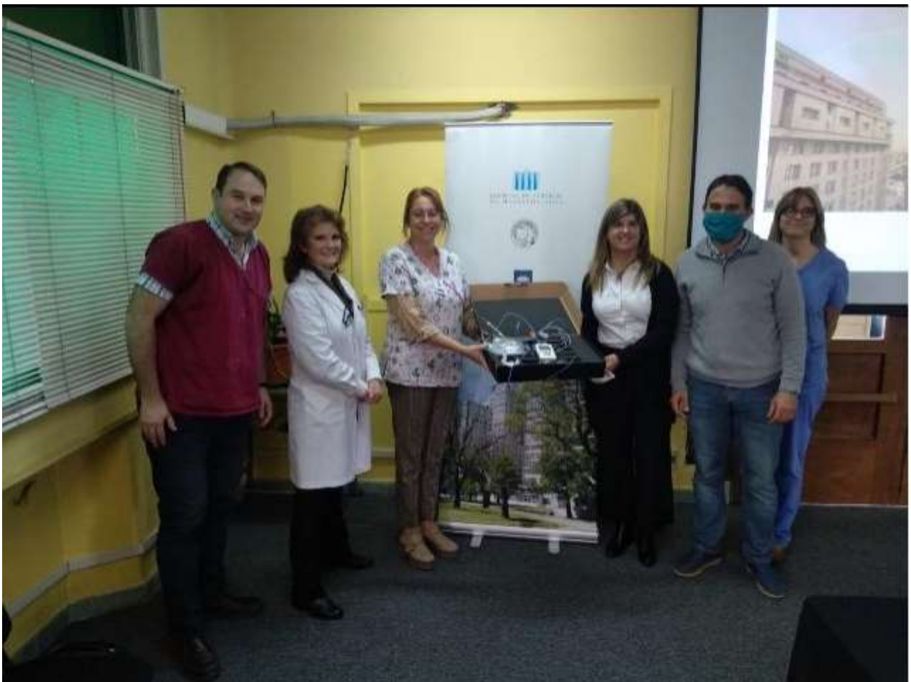
Foto de la entrega con la Directora del Hospital y demás autoridades.

Con esto queremos dar transparencia a los aportes que los clubes destinan al Distrito, gracias a todos!