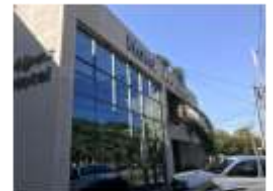
Los Alpes Santa Teresa Avenida Santa Teresa, Asunción. A 1000 metros del Hotel Sede USD 70 - GS 448.000